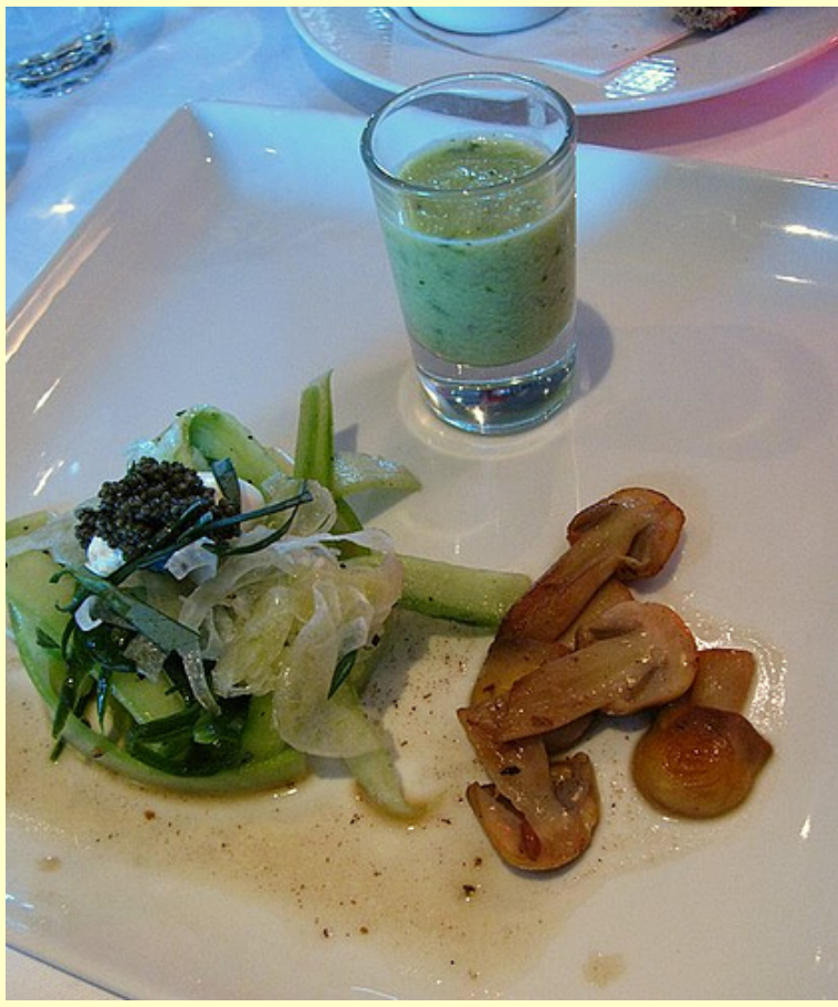
komkommersoep, komkommer-venkelsalade met varenkaviaar(!) en oesterblad(!) en gebakken anijschampignons