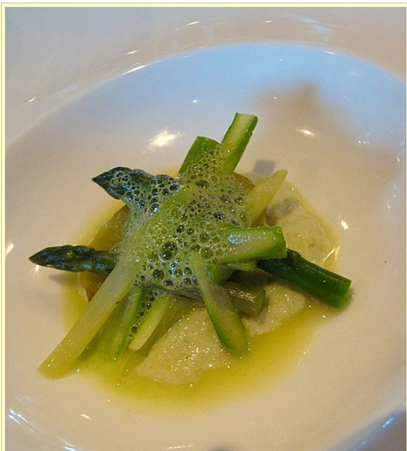
aspergepuree, asperges, waterkersschuim